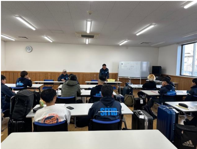
（会議室でのミーティング）

出発便が遅いため、PM2時に集合、韓国での過ごし方、試合の姿勢などの学びを行い、初めての海外旅行です。最初の食事は富士山静岡空港でした。荷物検査では、確認したペットボトル、はさみの没収など、これからが思いやられる出発になってしまいました。