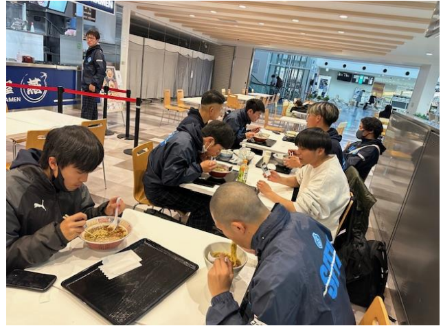
（富士山静岡空港での食事）

緊張した面持ちで出国検査、入国検査を終わり、宿舎のホテルへ、遅かったので本日は就寝！